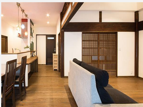
リノベーション・リフォーム事業