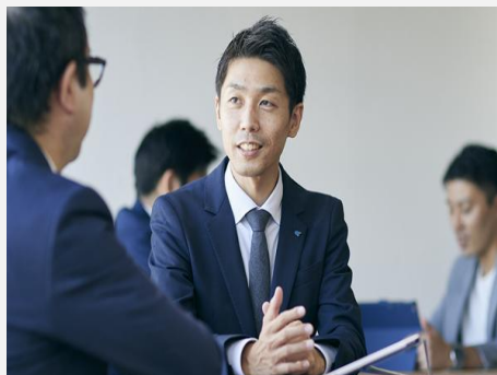
サプライヤーマネジメント事業