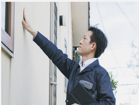
ハウジングストック事業