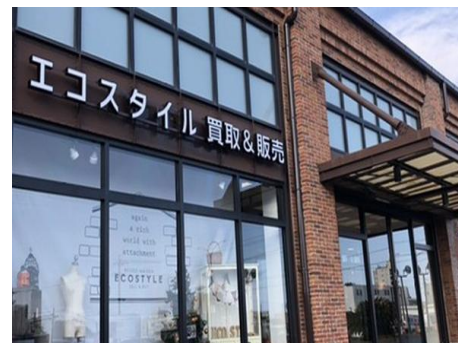
リユース事業(グループ会社)